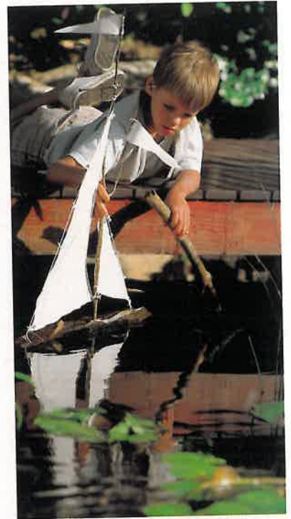
Das macht richtig Spaß: als Kapitän am eigenen Gartenteich

Ein Teich und die Lebewesen in, auf und neben ihm lieben das Sonnenlicht. Vier bis sechs Stunden täglich sollten es schon sein. Besonders die farbenprächtigen Seerosen und andere blühende Pflanzen sind auf Sonne angewiesen. Bäume und herunterfallendes Laub stören dagegen den Sauerstoffhaushalt des Biotops und begünstigen unerwünschtes Algenwachstum. Schön ist es, wenn sich am hauseigenen Biotop viele Tiere ansiedeln. Libellen und Wasserläufer kommen wie von selbst, wenn man das Wasser so gestaltet und bepflanzt, wie die Natur es einem vor-macht. Passt ihnen die Umgebung, wandern auch Kröten und Frösche zu. Wer der Natur nachhelfen will, holt aus einem nahe gelegenen Weiher Wasser und Schlamm zum eigenen Biotop. Die darin enthaltenen Kleinstlebewesen bilden mit ein bisschen Glück die Basis für eine ge-