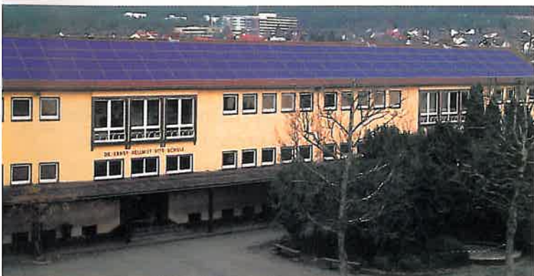
So soll das Sonnenkraftwerk auf dem Dach der Erlenbacher Schule später aussehen

mit großen Dachflächen zu nutzen. Eine Anlage entsteht demnächst in Erlenbach: Auf dem Dach der Dr.-Ernst-Hellmut-Vits-Schule werden noch in diesem Sommer 240 Quadratmeter Solarzellen installiert. Das nötige Eigenkapital für die Anlage brachten Privatpersonen im Rahmen einer Agenda-21-Initiative auf. Der EZV unterstützt das Vorhaben mit seinem technischen Know-how. Aus der Rentabilitätsberechnung geht hervor, dass sich die Investitionen für die Anlage in 20 Jahren amortisieren. Ab dann fließt der Ertrag der geschätzten 24 800 Kilowattstunden jährlich auf die Konten der Anteilseigner. Und weil die Anlage den Strom ohne bewegliche Teile produziert, sollte sie auch mehr als 20 Jahre problemlos ihren Dienst versehen.