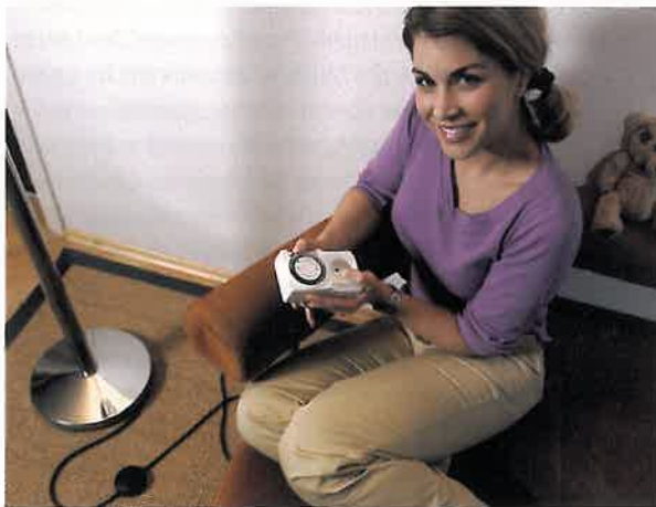
Zeitschaltuhren sorgen dafür, dass das Licht ein- und ausgeschaltet wird und die Rollläden auf- und zugehen

druck macht. Der Anrufbeantworter darf auf keinen Fall kundtun, dass man in Urlaub ist. Das lockt zwielichtige Gestalten an. Wer mit dem Auto in den Urlaub fährt, sollte es vorher gründlich durchchecken lassen – am besten von einer Werkstatt. Nicht vergessen: die Grüne Versicherungskarte. Vor allem im Ausland empfiehlt es sich, eine kleine Kamera griffbereit zu haben. Bei einem Unfall kann man die Situation so dokumentieren. Fotoapparate bis zu einem Wert von 50 Euro sind meist in der Teilkasko mitversichert. Die teure Fotoausrüstung hingegen darf man nicht im Wagen liegen lassen.