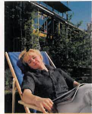
Mit Sonnenkraft Seite 12