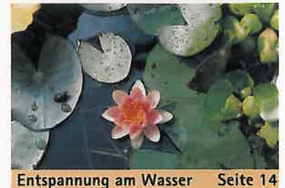
Entspannung am Wasser Seite 14