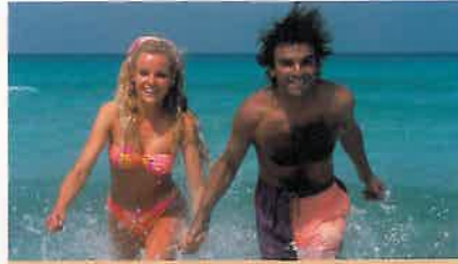
Klick und www.eg! Seite 6