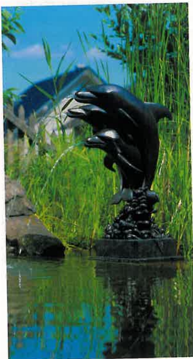
Springbrunnen gibt es in den unterschiedlichsten Formen und Größen

sunde Entwicklung des Teiches. Fische, besonders die gefräßigen Goldfische, ernähren sich von Eiern und Larven der anderen Teichbewohner. Sie stören so die Lebensgemeinschaft. Außerdem überdüngen Fischfutter und Kot das Wasser. Wer aber auf Fische nicht verzichten möchte, sollte heimische Fische, beispielsweise Stichlinge, in seinem Biotop ansiedeln. Dann muss die Sauerstoffversorgung allerdings ausreichend sein. Dafür gibt es Pumpen, die sich mit Wind- und Sonnenenergie oder Strom aus dem Netz des örtlichen Versorgers antreiben lassen.