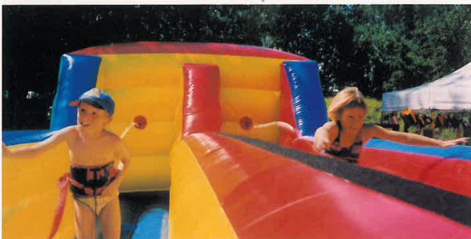
Ob Sumo-Ringen, Rennen am Gummiseil, Hüpfburg, Looping mit dem Fahrrad oder Bullenreiten – die Gaudi kommt beim Wörther Altstadtfest garantiert nicht zu kurz

Kulinarisches, Kultur, Musik, Spiel und Spaß – für jeden ist etwas dabei beim 3. Wörther Altstadtfest. Es beginnt am Samstag traditionell mit dem Festzug vom Bahnhof in die Altstadt. Bürgermeister Erwin Dotzel wird um 14.30 Uhr die Riesen-Fete offiziell mit dem Bieranstich eröffnen. Der Samstag steht fast ganz im Zeichen der Kultur. Kunsthandwerker bieten ihre Produkte auf einem Markt auf der Festmeile feil. Zwei Ausstellungen im Bürgerhaus und in der Schmiede Straub zeigen Werke verschiedener Künstler und Stilrichtungen. Das Schifffahrtsmuseum hat eine Sonderausstellung vorbereitet. Die kleinen Besucher können sich schminken lassen oder sich auf dem Karussell vergnügen. Zwischen 15 und 17 Uhr gibt's Guggen-Musik. Im Anschluss startet die Altstadtparty mit Live-Musik bis Mitternacht durch. Am Sonntag sind zusätzlich Fun und Action angesagt. Denn um 12 Uhr öffnet der Funpark seine Pforten. Der EZV holt anlässlich seines fünfzigsten Geburtstages verschiedene Highlights im Rahmen des Altstadtfestes nach Wörth: Bei Bullenreiten, Bike-Loop, Sumo-Ringen, Riesenrutsche und Bungee-Running werden große und kleine Action-Fans ihre