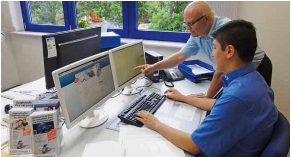
Auch die kaufmännischen Azubis der EZV arbeiten weitgehend eigenständig. Natürlich bekommen sie jede Hilfe, die sie brauchen.