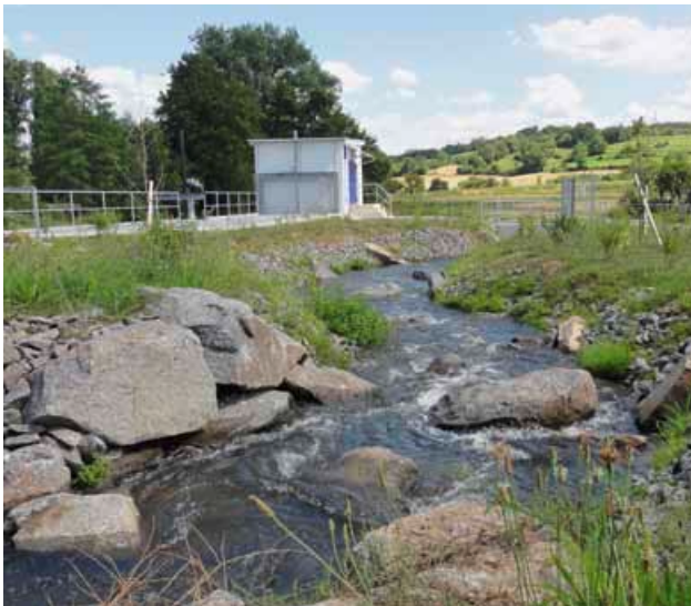
Die Aufstiegshilfe für Fische ist zwar künstlich angelegt, bietet aber vielen Arten die Möglichkeit, sich dauerhaft anzusiedeln. So entsteht neuer Lebensraum.

Fazit: Mit dem Wasserkraftwerk zeigt die EZV, wie gut sich Natur und wirtschaftliche Energiegewinnung unter einen Hut bringen lassen.