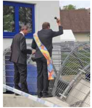
Vertreter beider Konfessionen baten anlässlich der offiziellen Einweihung um göttlichen Segen für das neue Wasserkraftwerk.

Der von Menschenhand geschaffene, aber naturnahe Bachlauf mit großen Steinen ermöglicht den in der Mömling heimischen Arten, etwa Bachforellen, Barben oder Nasen, die ungehinderte Wanderung. Und das ist noch nicht alles: „Wir haben die komplette An-