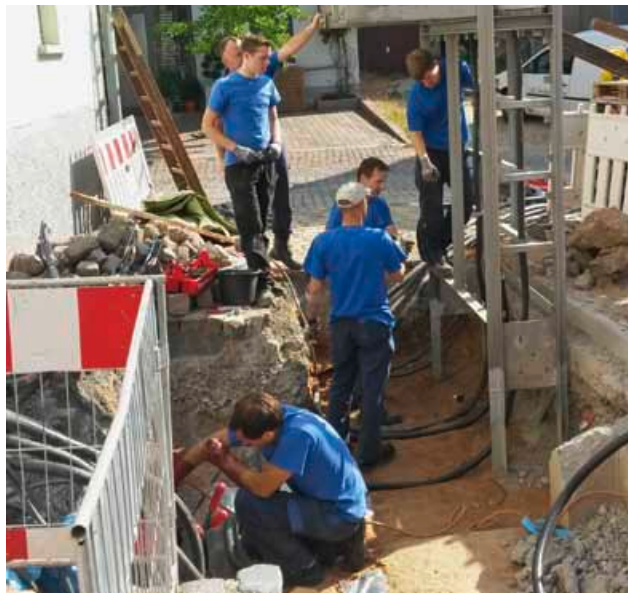
Bei der EZV gehört es zum Standard, dass die Auszubildenden so schnell wie möglich zusammen mit den erfahrenen Spezialisten auf der Baustelle arbeiten. Dieses praxisnahe Konzept hat sich als sehr erfolgreich erwiesen.

Dass die EZV auch Kriterien jenseits der Noten für die Auswahl der Bewerberinnen und Bewerber berücksichtigt, hat einen guten Grund: Wer zum Beispiel Sport treibt oder musiziert, hat dabei wahrscheinlich Verhaltensweisen erlernt, die auch für die Arbeit bei der EZV unabdingbar sind – etwa die Fähigkeit, im Team zu agieren, die Bereitschaft, Verantwortung zu übernehmen oder ein gewisses