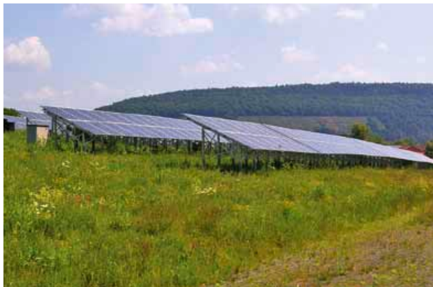
Im Jahresmittel beträgt die Ausbeute der Solarparks Wörth und Schippach etwa 2,52 Gigawattstunden Ökostrom – genug für 850 durchschnittliche Vier-Personen-Haushalte im Mainbogen.

Bei der groben Einteilung in vier Kategorien bleibt es aber nicht. Tatsächlich bietet die Karte eine gebäudegenaue Auflösung. Das bedeutet: Wer ein konkretes Haus anklickt, erhält genaue Informationen über die potenziell denkbare Solaranlage: PV oder Solarthermie, welche Größe und sogar, welche Einsparungen über 20 Jahre zu erzielen sind. Einen Klick weiter besteht dann die Option, sich