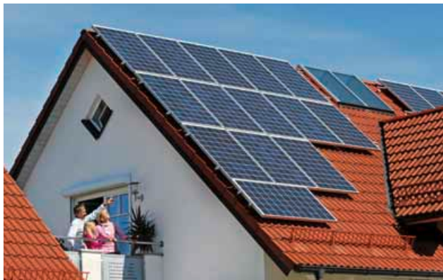
Auf einem durchschnittlichen Ein- oder Zweifamilienhaus reicht die Dachfläche üblicherweise für eine Photovoltaikanlage mit etwa vier Kilowatt Leistung.

Hauseigentümer in Erlenbach, Obernburg und Wörth