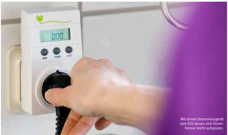
Mit einem Strommessgerät vom EZV lassen sich Stromfresser leicht aufspüren.

Die Strommessgeräte erfassen jede Menge Daten. Wichtig ist aber vor allem der tatsächliche Energieverbrauch in Kilowattstunden. Der kann nämlich deutlich vom ursprünglichen Wert abweichen. Beispiel Kühlschrank. Fabrikneu erreicht er die angegebenen Werte. Wenn aber im Laufe der Jahre die Türdichtung nachlässt, steigt der Stromverbrauch. Das Messgerät gibt auch Auskunft über ei-