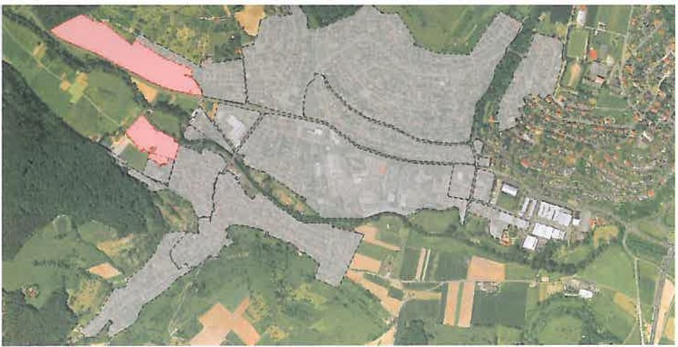
Die VDSL-Situation in Obernburg: In den grauen Bereichen ist die EchtZeitVerbindung verfügbar, die rot dargestellten Flächen wird der EZV bis Ende dieses Jahres erschließen.

Verbindung nutzen, um vom heimischen PC aus zu arbeiten“, prognostiziert Mario Kraus. Auf diese Weise bleibt mehr Zeit für die Familie, und die Haushaltskasse wird entlastet, weil das Auto stehen bleiben kann.