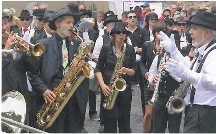
Zum Altstadtfest in Wörth gehört eine zünftige Blasmusik.

Diese Strategie zeichnet das Unternehmen von Beginn an aus. Als der EZV vor 60 Jahren antrat, sah die Welt noch anders aus. In den Anfangsjahren