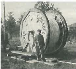
Erschließungsarbeiten in den Fünfzigern

herrschte ein wahrer Boom – der Stromverbrauch stieg explosionsartig. Folglich brauchte es ein Leitungsnetz, das entsprechend schnell mitwuchs. Den erforderlichen Netzausbau ermöglichten die weitsichtigen Anteilseigner. Denn die Stadt Wörth und die Gemeinde Erlenbach verzichteten damals auf ihre Ausschüttungen und legten so die Basis für das, worauf sich heute mehr als 23000 Menschen verlassen: ein modernes,